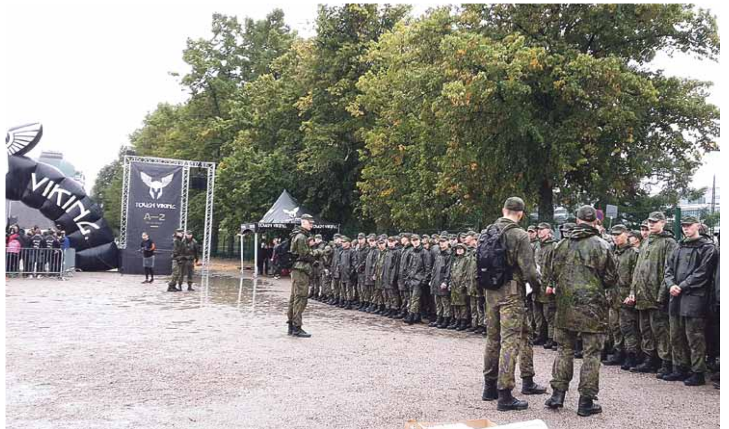
Ensimmäisen vuosikurssin kadetit osallistuivat kilpailuun osana viikonlopun ryhmäytymisharjoitustaan.

- Kilpailu on tietyllä tavalla haasteellisempi ja huomattavasti monipuolisempi kuin varuskuntien 500 metrin esterata. Valmistautumiseen riittää peruskunto, jos aikoo vain päästä maaliin. Jos aikoo mennä kovempaa, niin olisi hyvä juos-