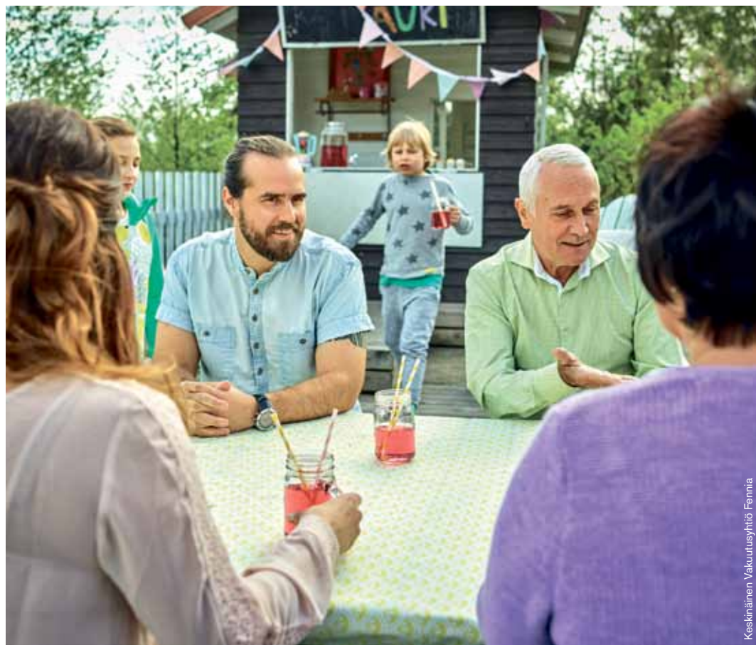
Keskinäinen Vakuutusyhtiö Fennia